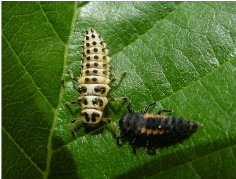
Larves de Sospita vigintiguttata et Harmonia axyridis

Guido Meeus ( http://www.ladauphinelle.fr )