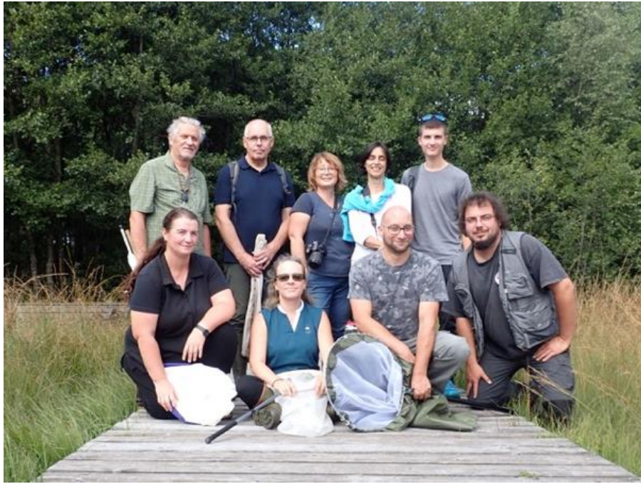
Photo de groupe de la sortie annuelle.