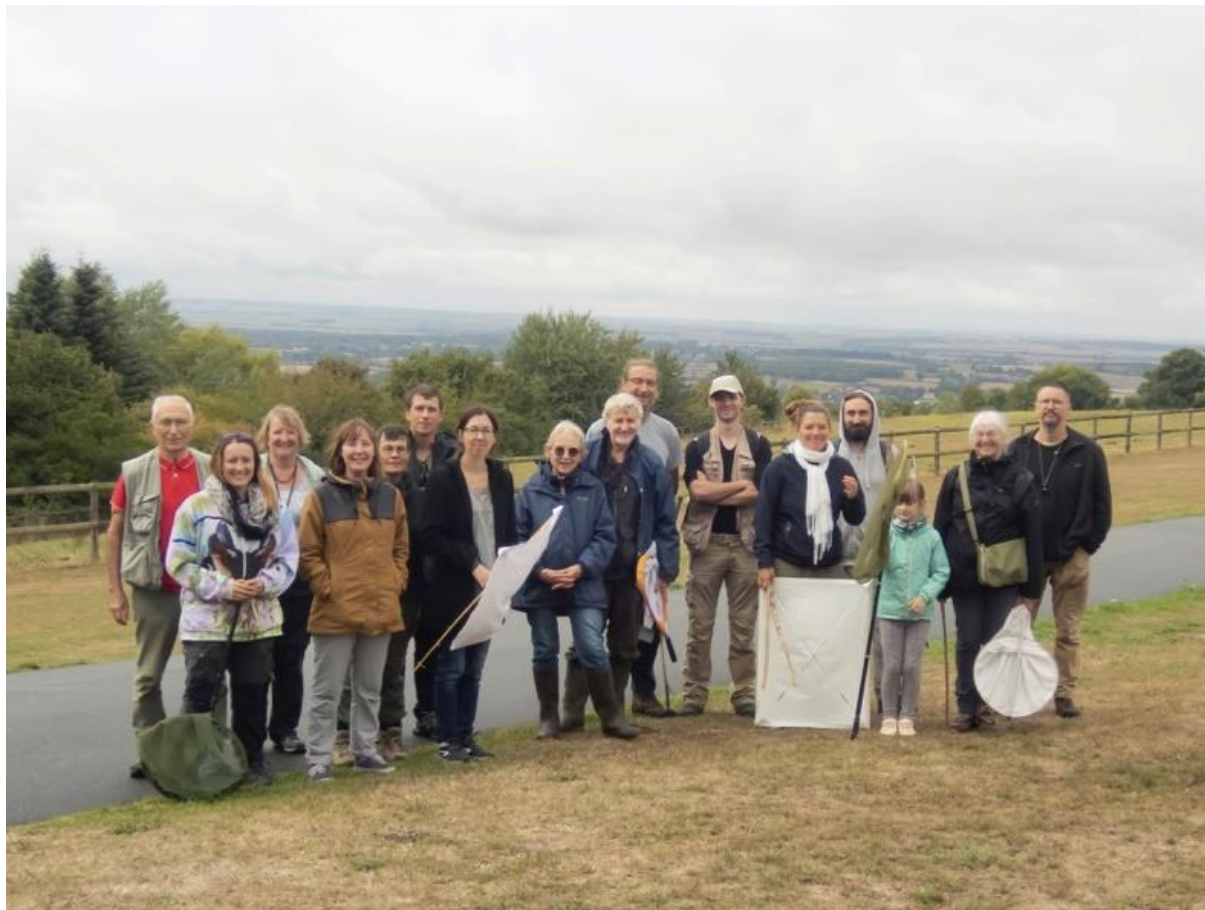
Photo de groupe de la sortie Gretia en Normandie